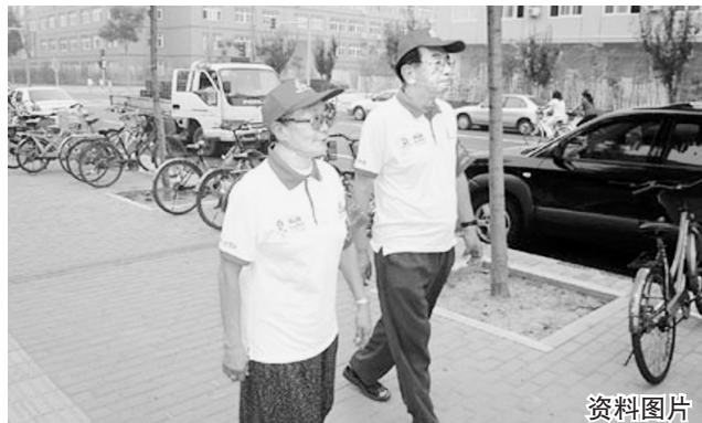
在北京,两名治安志愿者在巡逻。