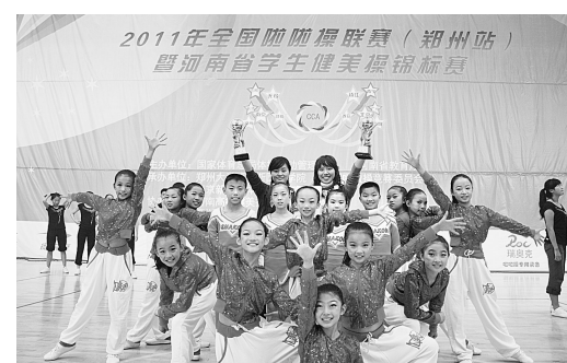
10月9日,在新郑举行的2011年全国啦啦操联赛(郑州站)中,郑州市金水区沙口路小学参赛的两个项目,取得了小学组规定花球第一名和规定街舞第一名的优异成绩。

传统赛事,旨在检验我省各地市跆拳道后备人才的储备情况。本次比赛共有37支代表队,根据参赛选手不同的年龄阶段,分为幼儿组、儿童组、少年甲组、少年乙组和中学组5个大组别。最终,郑州市青少年跆拳道俱乐部、商丘双勇跆拳道俱乐部和河南先锋跆拳道俱乐部,分获本次比赛团体总分前三名。