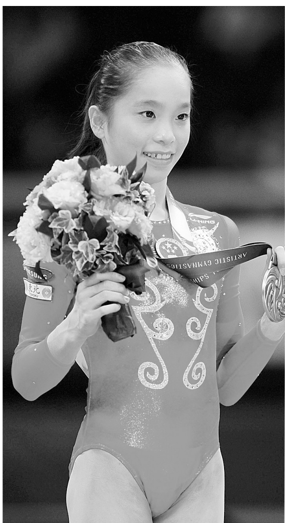
10月13日,中国选手姚金男在领奖台上。当日,2011年东京世界体操锦标赛举行女子全能决赛,美国选手韦伯以59.382的总分获得冠军,俄罗斯选手科莫娃以59.349的总分获得亚军,中国选手姚金男以58.598的总分获得季军。

施计划》后,我省举办的一次全省性的大型体质监测活动,活动所使用的国民体质监测车,拥有全国最先进的体质监测设备。据了解,在未来的时间内,国民体质监测车将“走街串巷”,为各界群众提供体质监测和科学健身指导服务。