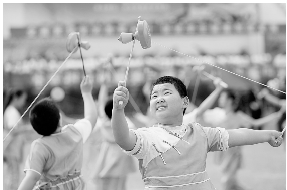
昨天上午,金水区阳光体育节在金水区第一中学隆重开幕,金水区教体局42个单位的代表队、8所学校的大课间展演队伍4000余名师生参加了开幕式。开幕式后,金水区2011年中小学生学习秋季田径运动会随之举行,而后的体育活动将贯穿全年。体育节将各类竞赛、体质健康测试、大课间和课外文体活动同12项比赛有机结合起来,金水区所有的中小学校都设立了分会场,将有8万多名中小学生和3000多名教职工参加到各项比赛中来。图为金水区文化绿城小学进行抖空竹表演。

据本届中国武术少林拳大赛仲裁、国家体育总局武术研究院专家委员会专家梁以全介绍,近年来,登封少林武术事业发展迅猛,海内外影响广泛,特别是随着少林武术走进大、中、小学生课堂工作的深入开展,少林武术修身养性、强身健身的时代价值、优势特色越来越受世人关注,习练少林拳的青少年越来越多,举办首届中国武术少林拳比赛势在必行。