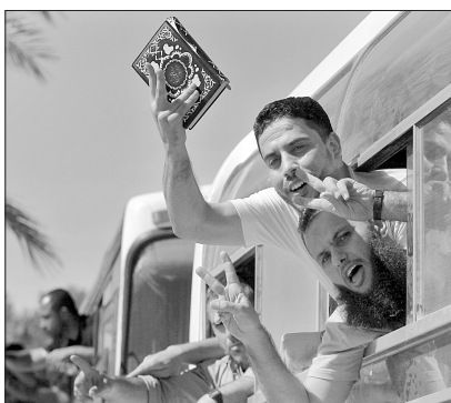
巴勒斯坦人获释后进入加沙地带。