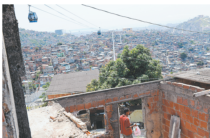
10月28日,缆车行驶在巴西里约热内卢阿莱芒贫民窟上空。2011年7月,一条长达3.5公里的缆车线路在这里开通,票价仅为1雷亚尔(约合0.6美元),阿莱芒贫民窟里的居民可以每天两次免费搭乘缆车上山。