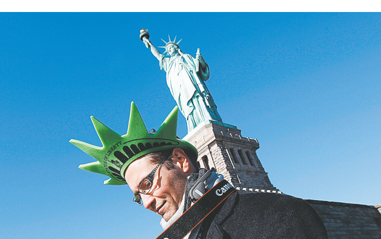
10月28日,在美国纽约,一名男子在自由女神像所在的自由岛参加庆祝典礼。纽约市当日举行盛大仪式,庆祝自由女神像落成125周年。来自40多个国家的125位移民当日在自由女神像下宣誓成为美国公民。