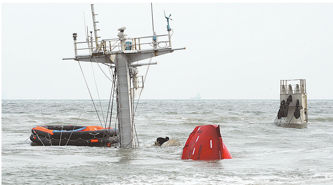
10月29日,已经沉没的巴拿马籍货轮“ORIENTAL SUNRISE”轮桅杆顶部露出海面。10月28日19时35分许,两艘巴拿马籍货轮在山东青岛海域相撞,一艘货轮沉没。经初步核实,船上共有19人,已有9人获救,其中3名受伤人员已送往医院治疗,其他船员正在搜救过程中。经记者初步核实,沉船上19名船员全部为朝鲜籍。