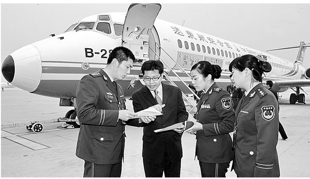
10月31日,台湾远东航空公司开通台北至石家庄直飞航线。石家庄边防检查站的检查员在为台湾远东航空公司飞机机组人员办理边检手续。

本报讯(记者 张丽霞 通讯员 晋培红)昨日,投资1亿元的110千伏程庄变电站一次送电成功。宇通集团有限公司分公司和双汇集团郑州分公司由此解决了用电后顾之忧。 今年9月份,郑州宇通集团有限公司和漯河双汇集团两家公司同时扩张,并且都把厂址选在了郑州东南方向50里的郊外。为了解决这两家企业的用电难题,郑州供电公司工程公司80余名施工人员夜以继日,程庄变电站从开工到竣工仅用了30天就全部安装完毕。