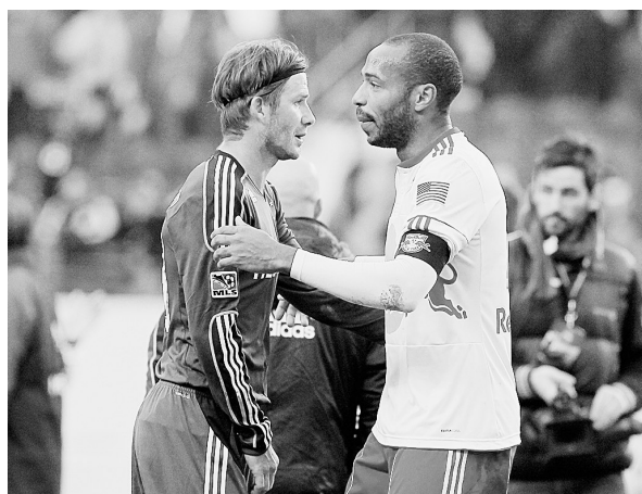
10月30日,洛杉矶银河队球员贝克汉姆(左)与纽约红牛队球员亨利赛后互相问候。当日,在美国职业足球大联盟比赛中,贝克汉姆与亨利代表各自的球队出场,最终,洛杉矶银河队以1:0战胜纽约红牛队。

据悉,本次比赛共吸引了来自郑州、平顶山、安阳、新乡、三门峡、南阳等六个省辖市15支代表队的近300名小选手参赛。比赛设有规定操(徒手操、圈操)和自编操两个竞赛项目,参赛的小选手全部为2005年1月1日以后出生的学龄前儿童。