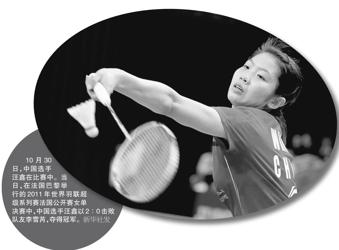
10月30日,中国选手汪鑫在比赛中。当日,在法国巴黎举行的2011年世界羽联超级系列赛法国公开赛女单决赛中,中国选手汪鑫以2:0击败队友李雪芮,夺得冠军。

友毕津浩配合,最终由张璐劲射破门,率先打破场上僵局。之后张力和苏靖宇再度破门,上半场建业队就以3:0的绝对优势领先。下半场,建业队攻势不减,第65分钟,建业打出精彩配合,最终于乐轻松推射空门,将比分定格在4:0。