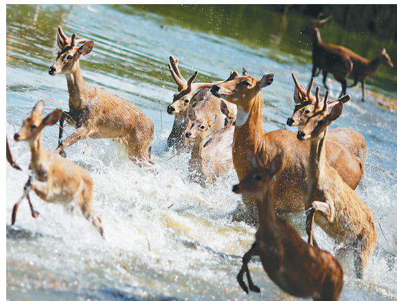
11月2日，在泰国首都曼谷的一家野生动物园，鹿群在洪水中奔跑。入侵的洪水已经将这家野生动物园一半的土地淹没。

据新华社电 曼谷市政府一名发言人3日说，曼谷城区1/5遭水淹，希望受影响居民加紧撤离。这名发言人介绍，受影响居民的具体人数尚不清楚，眼下1.1万人居住在临时避难场所。