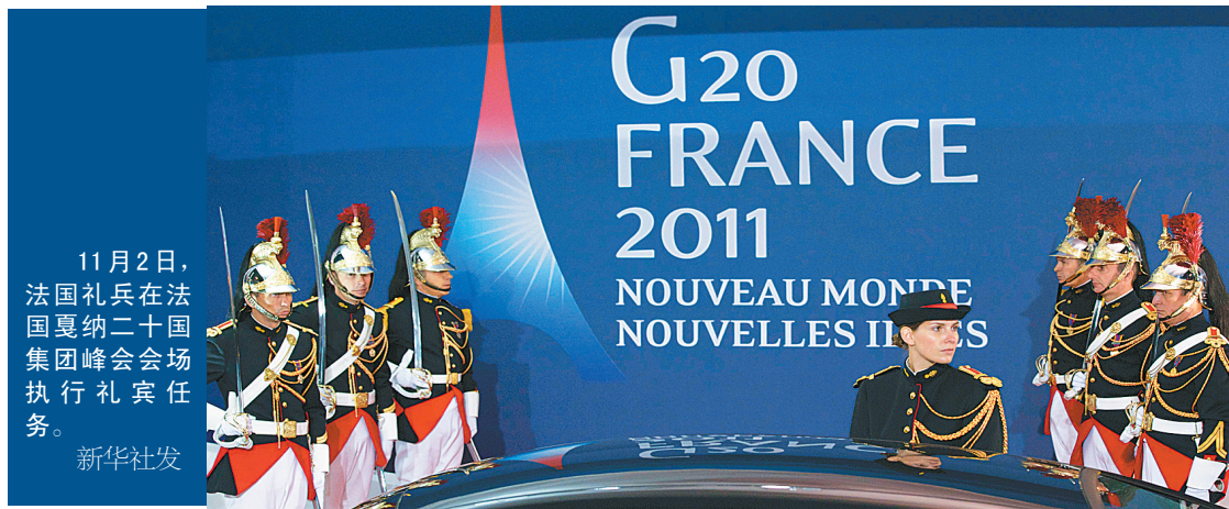
11月2日，法国礼兵在法国戛纳二十国集团峰会会场执行礼宾任务。

此前各方向希腊承诺的第六批救助款总计80亿欧元（约合110亿美元），而12月11日，希腊需支付的到期债务约为120亿欧元（约合165亿美元）。