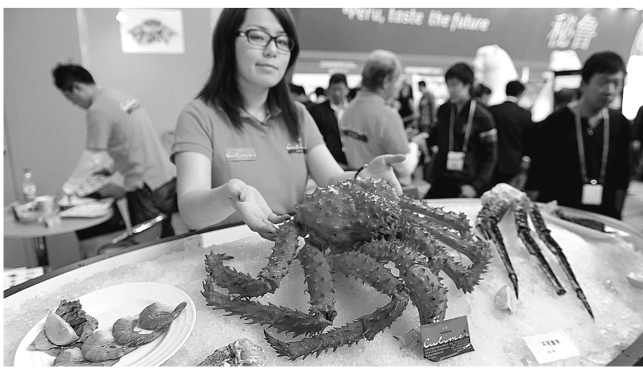
近日,被业界称为世界三大渔业展览之一的第十六届中国国际渔业博览会在山东省青岛市举行,吸引了来自39个国家和地区的近800家参展商参展。展出内容包括水海产品、养殖技术与品种、水产加工及养殖设备等。展会同期,还将举办“2011水产品加工技术对接会”和“第三届中国可持续水产品发展研讨会”。