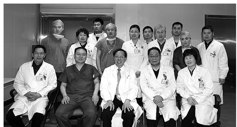
2011年3月,医院聘请国际著名心脏病专家林延龄教授(前排中)为医院首席专家

近年来,医院在发展的同时,以人为本、关注民生,推出了多项惠民利民措施,尽心竭力为患者提供优质服务。通过开展“公益活动日”、“免费义诊周”、“专家奉献月”等活动,为万名空巢老人免费健康体检、参加儿童免费手术等,组织义诊宣传队深入社区农村义诊,推出来院就诊可免挂号费及检查费等系列优惠措施,免费接送郑州市城区内孕产妇等等,以实际行动为提高广大人民群众健康水平作出了积极贡献。