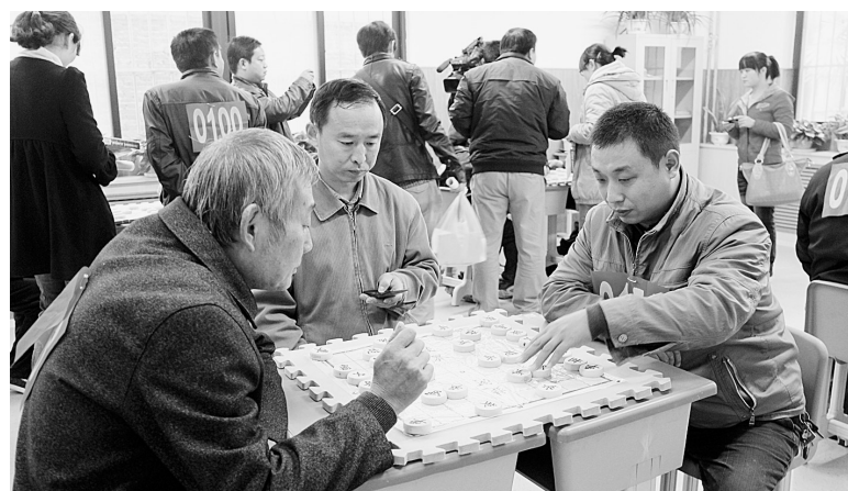
为活跃基层残疾人文化体育生活,二七区残联和二七区教体局近日联合举办了一场残疾人趣味运动会。此次活动设有摸石头过河、蚂蚁搬家、合家欢、双升等8个项目,共吸引来15支代表队、160余名运动员参加。