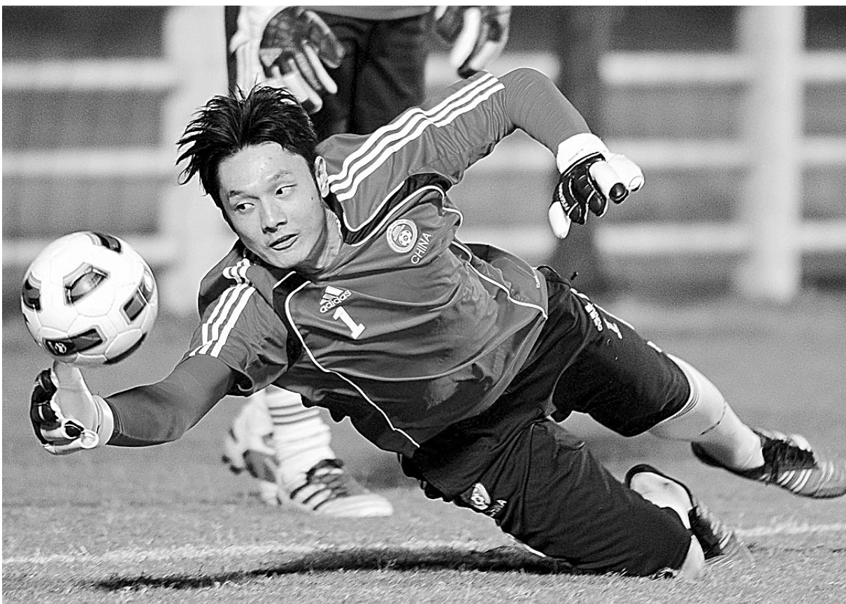
北京时间今晚10:15,中国队将迎来与伊拉克队的“决战”。事实上,世界杯预选赛亚洲区20强战中,中国队剩下的三场比赛每一场都是“决战”、“生死战”,只有三场全胜,中国队才能将出线的命运掌握在自己的手中。当然,如果今晚中国队不能击败对手,那后两场比赛也就失去了意义。