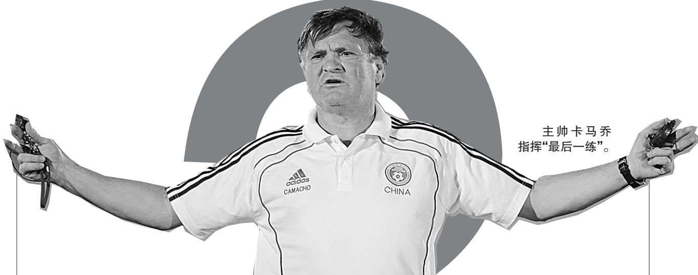
主帅卡马乔指挥“最后一练”。

与此同时,央视方面也对明年直播中超制订了初步计划,明年央视将全程转播至少70场中超联赛。如此的报道力度,在中国足球的历史上将是史无前例的。这就意味着,中超明年30轮比赛,央视将至少在每轮转播两场比赛。