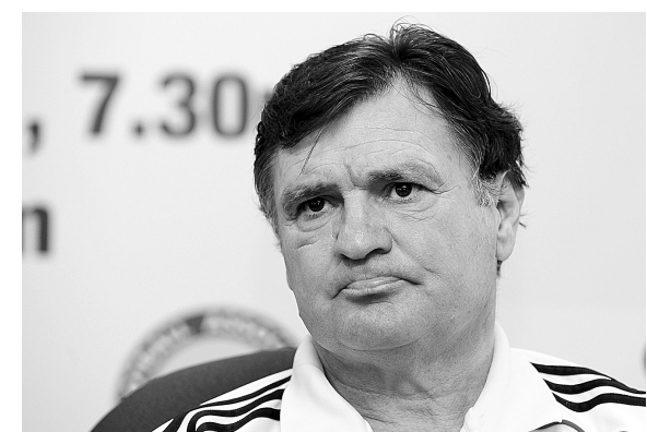
卡马乔在新闻发布会上。

由于新加坡和中国队小组出线的希望均不大,一些记者提问,是不是会考虑安排更多的年轻球员。卡马乔表示,对待国家队的比赛仍会从国家队的角度考虑问题。不过,他也表示,肯定会在人员上作出一些调整,因为此前有些队员受伤了。