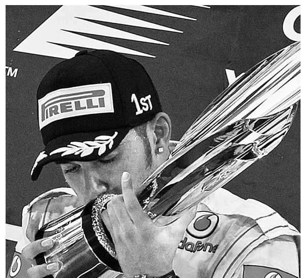
11月13日,迈凯轮车队英国车手汉密尔顿在颁奖仪式上亲吻冠军奖杯。当日,在阿联酋举行的F1阿布扎比大奖赛中,迈凯轮车队英国车手汉密尔顿最终夺冠,这是他本赛季第三个分站赛冠军。

关于即将开始的足协杯转播问题已经落实,包括中央电视台在内的全国多家电视台将直播11月19日进行的这场鲁津大战,本场足协杯决战也是央视做出“全面恢复直播国内足球赛事”这一决定后直播的首场比赛。