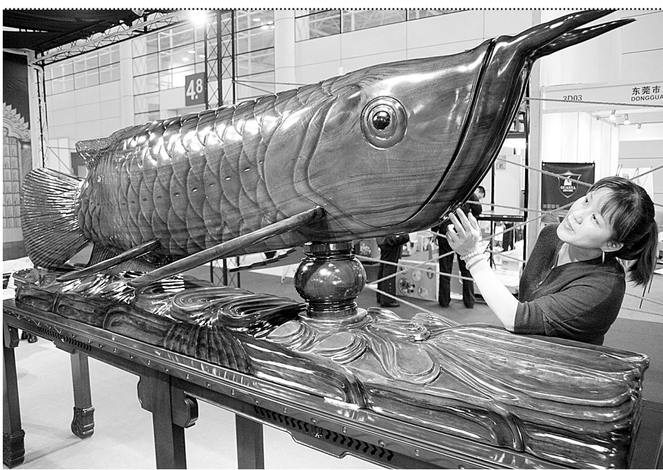
11月16日,由中国对外贸易中心(集团)、福州市人民政府、福建省对外贸易经济合作厅主办的2011中国(福州)家居建材博览会,海峡西岸(福州)第25届住交会于福州开幕。本届博览会倡导“绿色、环保、和谐、宜居”的新理念,吸引了来自国内外众多知名家具、建材品牌厂商前来参展。 图为用整块印尼铁木雕刻而成的金龙鱼。 新华社发

法院认为,徐某夫妇不履行法律文书确定的义务,已违反《最高人民法院关于限制被执行人高消费的若干规定》,遂决定对徐某夫妇以司法拘留15日。