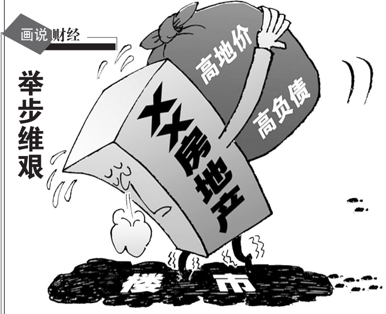
画说财经 举步维艰

但是,菲律宾马尼拉股市主要股指下跌0.16%。新加坡股市海峡时报指数下跌1.04%。印度孟买股市敏感30指数下跌1.87%。中国香港股市恒生指数下跌0.76%。