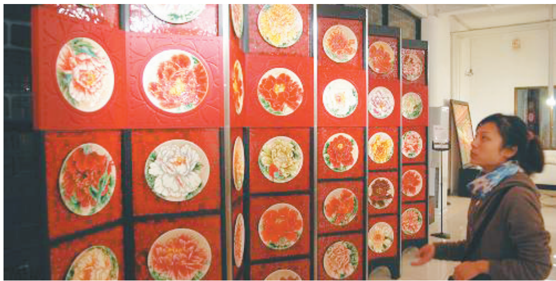
洛阳民间博物馆的藏品特色鲜明

11月初,新华网报道说,明年年初,洛阳市将有8家民间博物馆相继“出阁”。洛阳的状况仅是我省民间博物馆快速发展的一个缩影。近年来,中原大地上如雨后春笋般涌现出数以百计的民间博物馆,超过了全省国有博物馆的数量。 荥阳农民自学成为文物专家,建成全省最大的民间陶瓷馆;太康农家院里,办起了民俗博物馆;安阳民间博物馆的“宝贝”让人惊叹,专家称比国有博物馆的藏品还好;全国首家外国艺术博物馆落户郑东新区,系民间人士筹建,填补了我国收藏界的一大空白…… 然而,普遍“差钱”、人才短缺、运作乏力等诸多难题,也制约着民间博物馆的发展。前不久召开的党的十七届六中全会对推动社会主义文化大发展大繁荣作出了全面部署,民间博物馆将迎来发展的春天。