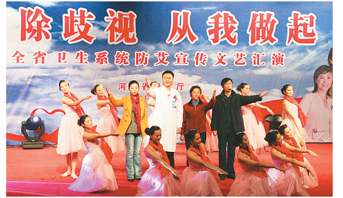
郑大一附院日前开展“消除歧视 从我做起”系列活动。