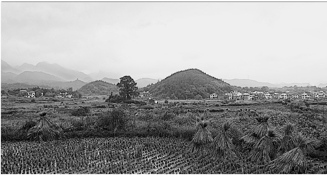
庐山脚下

背景深厚的张子诺空降到凤祥市做金融服务办公室主任。他的到来引发了金融权力格局的重新洗牌和权力分配。书中讲到张子诺初到金融办就分配了两项工作，一是省里金融办和建行省分行已经签订了合作协议，大力支持地方上小额信贷公司的发展，二是筹建凤祥市证券培训研究中心。这两项举措引