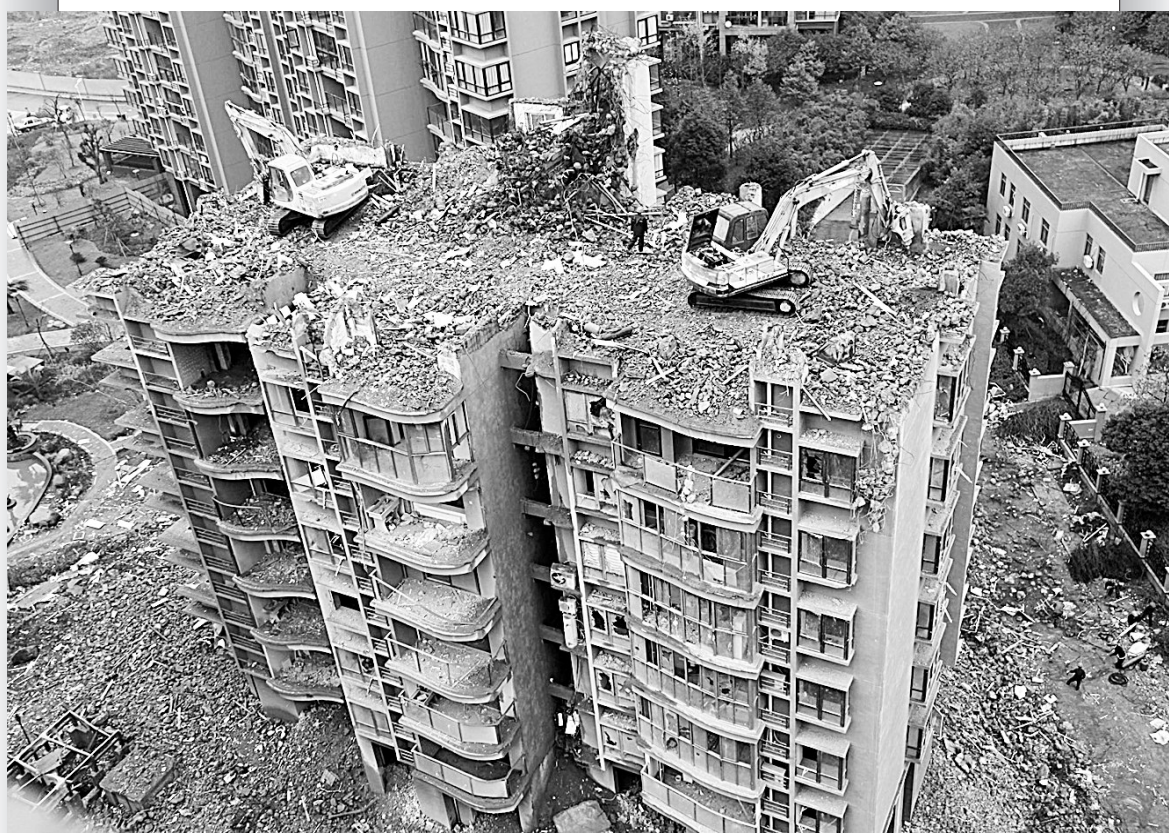
12月6日,在浙江台州市玉环县“渝汇蓝湾国际小区”,挖掘机在拆除17号住宅楼。据《东方早报》报道,今年11月1日下午,该幢高层住宅楼突然出现沉降,导致楼体向西倾斜。专家初步调查认为,大楼桩基承载力不足是导致“楼歪歪”的主因。据了解,这幢住宅楼于2011年1月通过竣工验收投入使用。