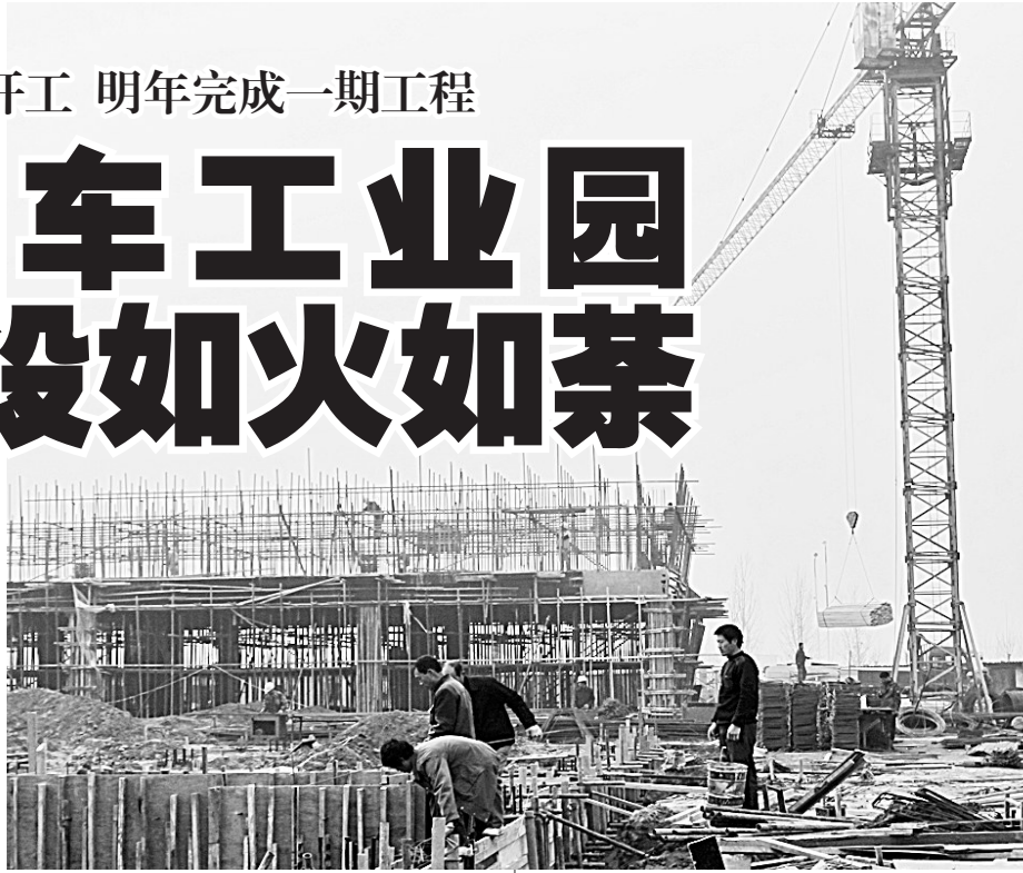
上图:热火朝天的建设景象。

据介绍,今年以来,东风路街道强力优化经济发展环境,突出重点项目建设,不断加快推进速度,成立了多个重点项目指挥部,抽调机关和村组骨干人员组成专项工作组,吃住在工地,深入项目一线,现场办公,跟踪服务,全程协调,积极化解处理项目征地和建设过程中的矛盾和问题。