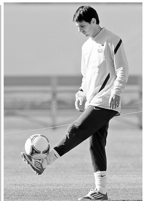
12月12日,巴塞罗那队球员梅西在训练中。当日,西甲巴塞罗那队在日本横滨进行训练,备战国际足联世界杯与卡塔尔阿尔萨德队的比赛。