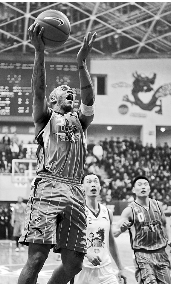
12月11日,北京男篮球员马布里(上)在比赛中上篮。当日,在2011/2012赛季中国男子篮球职业联赛(CBA)第十轮比赛中,江苏中钢铁队主场以96:109负于北京男篮。

常言道:“老将出马,一个顶俩。”由此可见,老将的威力是何等巨大。在CBA的赛场上,就活跃着这么一帮老将,他们不再年轻,但依旧生龙活虎;他们不再举足轻重,但依旧坚如磐石……老将已然成为CBA赛场一道靓丽的风景线。过去一周,老将们用精彩的演绎,续写着“老将出马”这一不老传奇的辉煌。