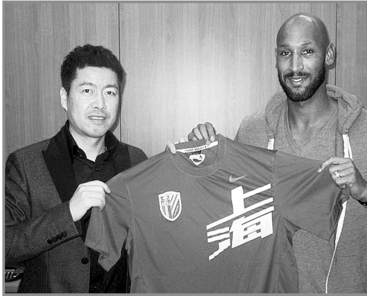
阿内尔卡(右)与申花俱乐部董事周军合影。

出生于1979年的阿内尔卡司职前锋,目前效力于英超豪门切尔西俱乐部。此前他曾效力过的俱乐部包括利物浦、阿森纳、曼城、巴黎圣日耳曼和皇家马德里。阿内尔卡很早即入选法国国家队,但性格“桀骜不驯”的他世界杯之路一直不顺,直至2010年南非世界杯时才迎来自己的首次世界杯之旅,结果因为与主教练发生冲突,只踢了一场半决赛即被除名。