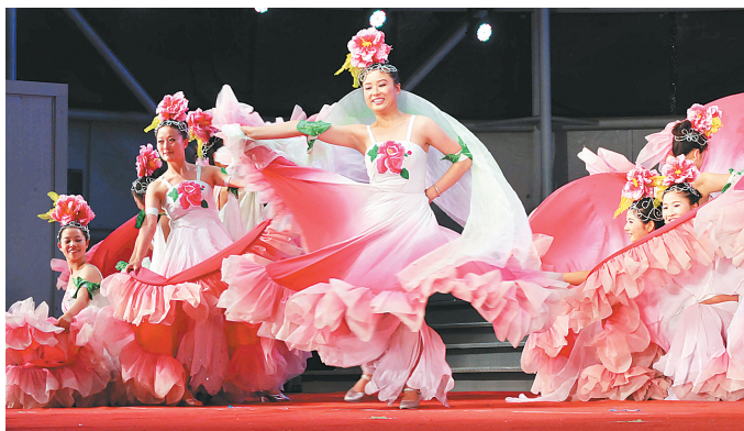
社区居民在广场文化活动中表演文艺节目

到2012年,巩义市、荥阳市图书馆、文化馆按照国家一级馆标准建成并向市民开放;登封市图书馆、文化馆按照国家一级馆