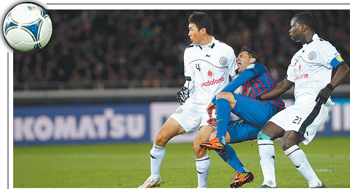
12月15日,在日本横滨举行的2011年世俱杯半决赛中,欧冠联赛冠军西班牙巴塞罗那队以4:0战胜亚冠联赛冠军卡塔尔的阿尔萨德队。巴塞罗那队球员比利亚(中)在比赛进行到第36分钟时受伤。巴塞罗那官方确认,比利亚左脚踝骨骨折,已经送入医院进行检查。

1胜11负,得失分差为-18.58分,联赛积分榜排名垫底。这就是河南豫光金铅女篮在本赛季WCBA半程结束后交出的成绩单,怎能想象,这支队伍曾在前一个赛季创造了勇夺常规赛冠军,总决赛亚军的辉煌。外援能力不够,本土球员年轻缺乏经验,正是在如此“外”患“内”忧的困扰下,河南女篮曾经的辉煌变成了残酷的现实,球队也在郁闷中度过了半赛季的征程。