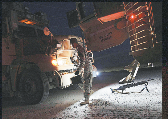
▲12月18日,一名美国士兵从伊拉克进入科威特边境地区后从车内走出。