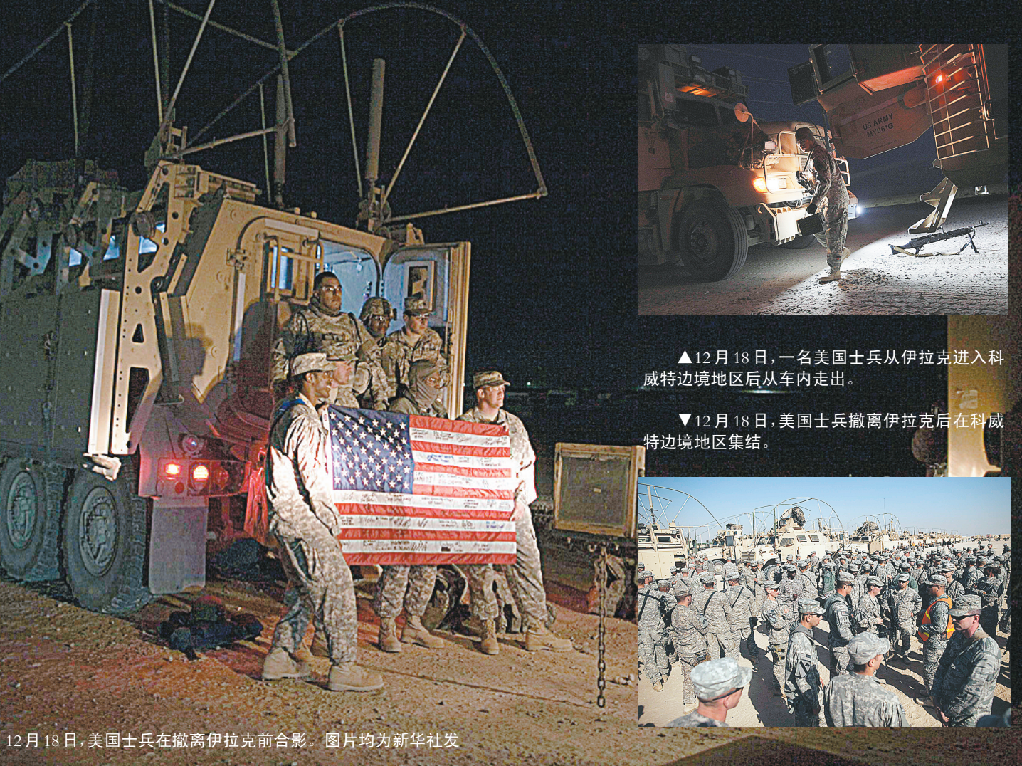
12月18日,美国士兵在撤离伊拉克前合影。图片均为新华社发

一些分析师认为,对美国而言,打击伊拉克的真实目的是在阿拉伯世界腹地扶植一个亲西方的新政府。不过,8年过去,如今的伊拉克或许不是美国想要的那个。