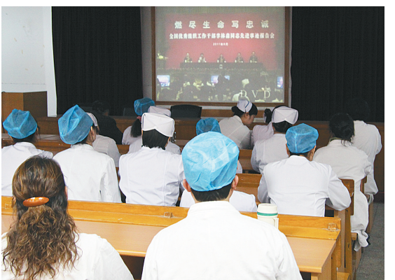
近日,市口腔医院组织党员干部集体收听收看全国优秀组织工作干部李林森同志先进事迹报告会。