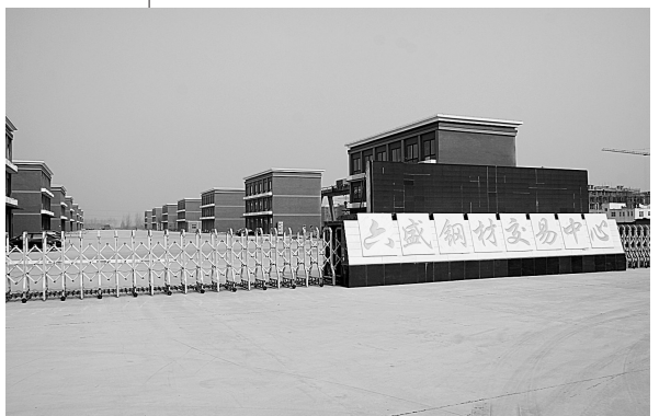
六盛钢材交易市场。