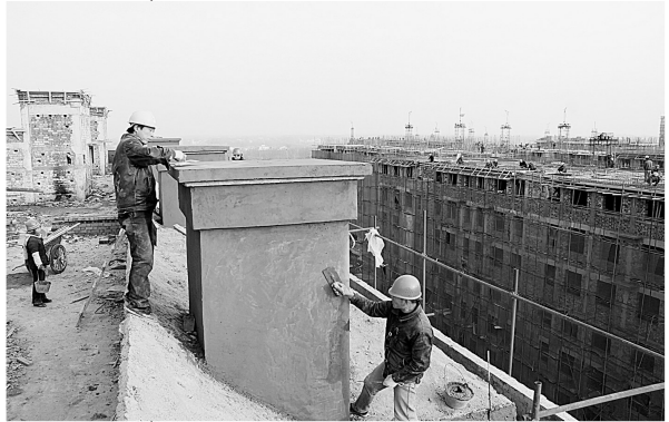
鸡王新型农村社区安置房正在封顶。