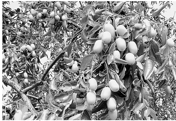
孟庄镇是著名的红枣之乡。每到金秋时节,枣园里玛瑙般的大枣挂满枝头,煞是惹人喜爱。