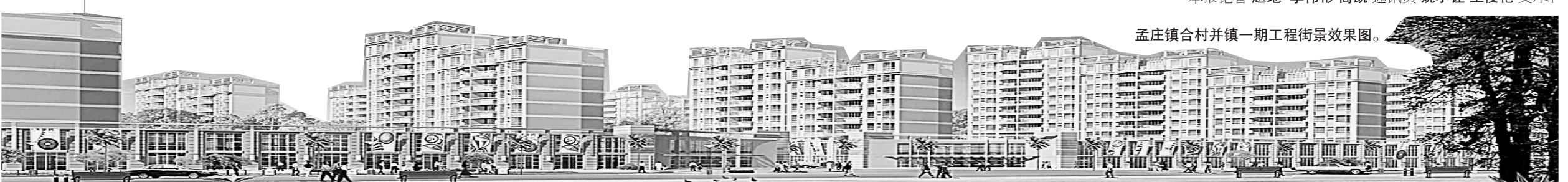
孟庄镇合村并镇一期工程街景效果图。