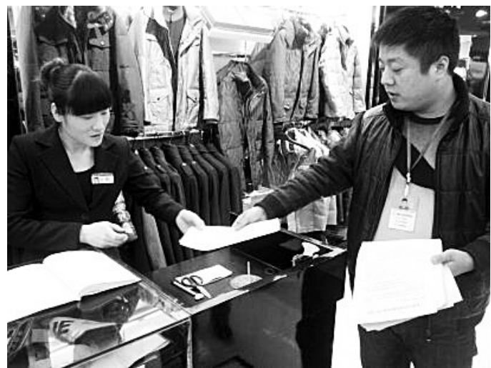
为有效防止辖区火灾事故的发生,长江路街道办事处专门印制3000余份《致辖区居民群众和沿街商户的一封信》,在辖区所有的小区、楼院门前张贴,宣传消防常识。

据了解,到2012年5月,郑煤机集团一期改造项目将全部完工,届时将再满足156户居民乔迁新居。