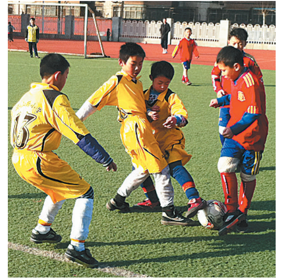
24日,郑州市校园足球联赛继续鏖战。图为华山路小学足球队在自己的主场,与春晖小学足球队激战正酣。

与会专家一致认为,《追寻》带有很强的草根性,作者以自身20多年的艰难生活经历为蓝本,真实地再现了一个漂泊者对生活和文学梦想的追求,其作品平实质朴,具有很强的现实感。