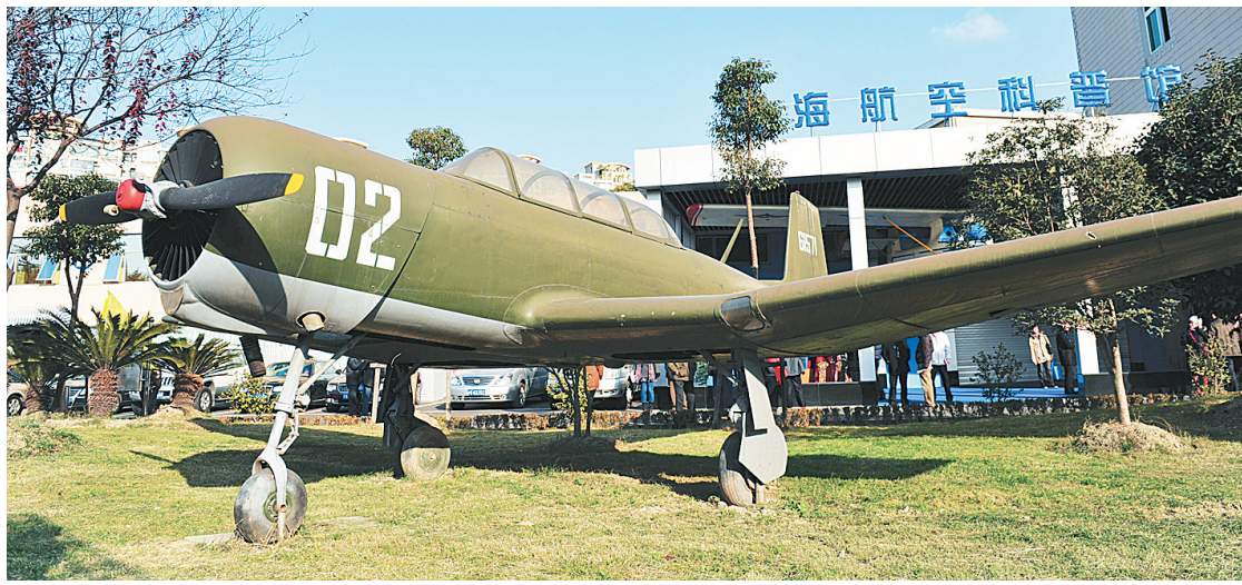
上海航空科普馆展示的“初教-6”型教练机。12月30日,上海航空科普馆正式开馆,同时被命名为中国大飞机科普宣传基地、上海市专题性科普场馆、“二期课改”定点科普教育基地、上海市科普旅游示范基地。

记者了解到,侦查工作中,海关缉私部门和检察机关反贪部门坚持依法、公正、文明办案,充分保障犯罪嫌疑人赖昌星及其他涉案人的合法权益,对赖昌星聘请会见律师等依法提供条件和做出安排。