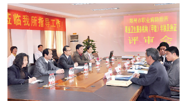
市职业病防治所领导指导工作

为了让广大市民了解电磁辐射对人体的危害,该所专家利用双休日,携带现场采样设备,积极参与“爱心公益进社区”大型公益活动,为社区居民检测微波炉、电脑等,受到了社区居民的广泛好评。