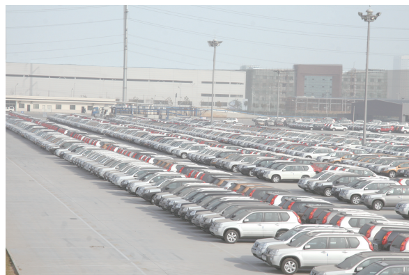
整铸铸件的郑州日产第二工厂下线产品“奇骏”与“逍客”