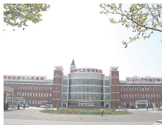
郑州市第七人民医院

辉煌业绩渐成过去,美好画卷徐徐展开。经开区,一个充满希望的先进制造业基地,一个产城融合的幸福新城区,正开足马力,扬帆起航。