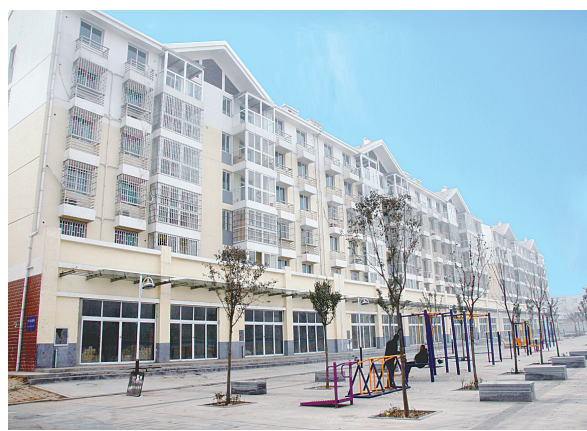
经开区农民安置小区