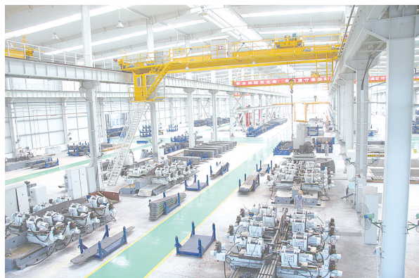
郑州煤炭机械集团高端液压支架项目车间