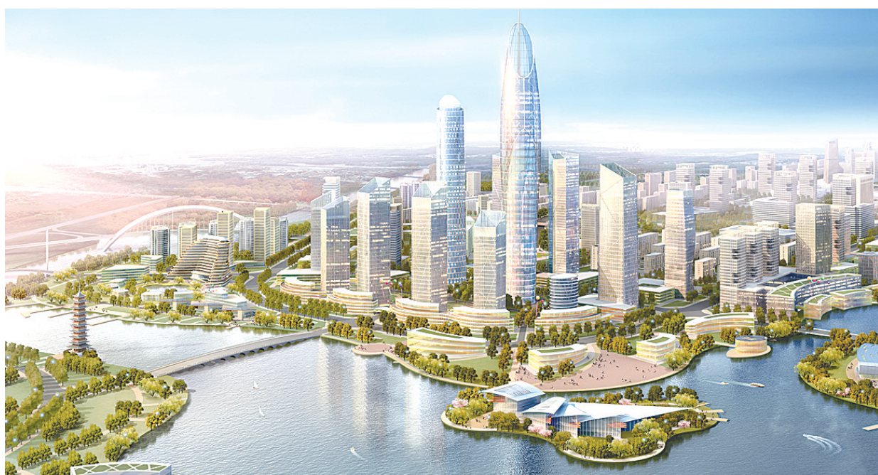
经开区滨水新区效果图

中心城区功能提升(商业文化宜居区)方面:目前已编制完成了商业文化宜居区控制阶段城市设计,并投资1573万元实施了市政设施建设和道路维修维护;开展了“五项重点工作”,新建停车位1749个,占道经营、基础设施、户外广告、架空线缆等得到整治;对航海路实行了以绿化景观提升、路面病害清理、市政设施完善为内容的整治。