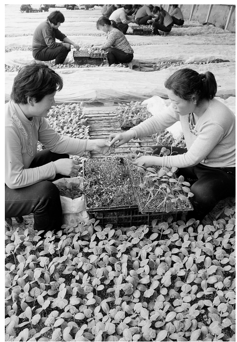
眼下虽然是寒冬腊月,但河南内黄县马乡八里庄村200亩育苗工厂里却是一派农忙景象,瓜农们忙着进行西瓜嫁接作业,为春节后的反季节西瓜种植准备秧苗。图为河南省内黄县马乡八里庄村瓜农在嫁接瓜苗。

目前,市场上主要有三种黄金投资品种,即黄金的实物交易,包括金条、金币等;纸黄金交易;黄金现货保证金交易。国内只有上海黄金交易所和上海期货交易所的交易平台才是合法的黄金现货和期货交易的平台。