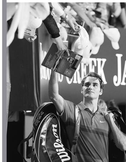
费德勒为球迷签名。