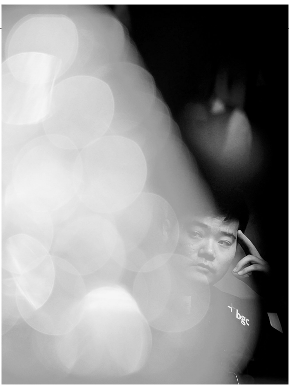
1月15日,中国选手丁俊晖在大师赛冠军奖杯旁沉思。当日,在2012年斯诺克大师赛首轮比赛中,丁俊晖以4:6不敌英格兰名将奥沙利文。

太医拳传习所相关负责人告诉记者,该所被郑州市文广新局确定为郑州市非物质文化遗产展示馆,这将更有利于此拳种的传承与发展。