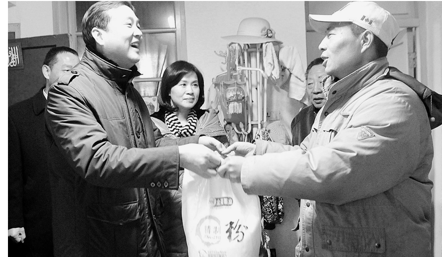
河南瑞贝卡大酒店日前出资2万多元慰问管城区贫困户。

春节快到了,如何让社区困难群众过一个温暖祥和、平安快乐的春节?今年社区帮扶有什么特点?日前记者兵分几路,走访了郑州市部分社区。