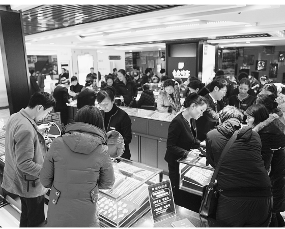
18日,金鑫珠宝正弘店开业彩排,河南最大体量珠宝商场亮相二七商圈。这是金鑫珠宝耗资50亿元打造的面积8000平方米的珠宝商场。金鑫珠宝正弘店首创珠宝商场业态,以“专业化、特色化、规模化”的经营理念,全面开启一站式、体验式发展新模式。

总决赛由著名声乐教育家、中国音乐家协会副主席金铁霖、河南歌舞剧院院长周虹、河南大学音乐学院教授黄慧慧、河南大学文学院教授王立群担任决赛专家和评委,省内外电视、报纸、网络、平面、全媒体等记者30人担任大众