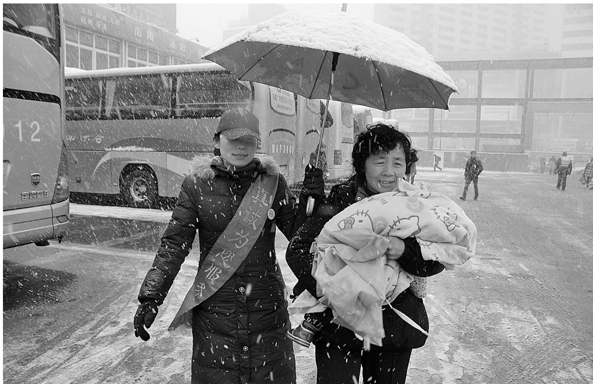
昨日,我市雪花飘洒,长途汽车客运中心站举行“请让我来帮助你”活动,为旅客撑起爱心大红伞。

据悉,这两项补贴所需资金均由各级财政负担,其中市、县(市、区)财政各承担50%。