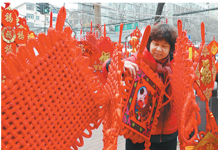
一位郑州市民在挑选喜庆挂饰。春节期间,各种喜庆的挂饰俏销。