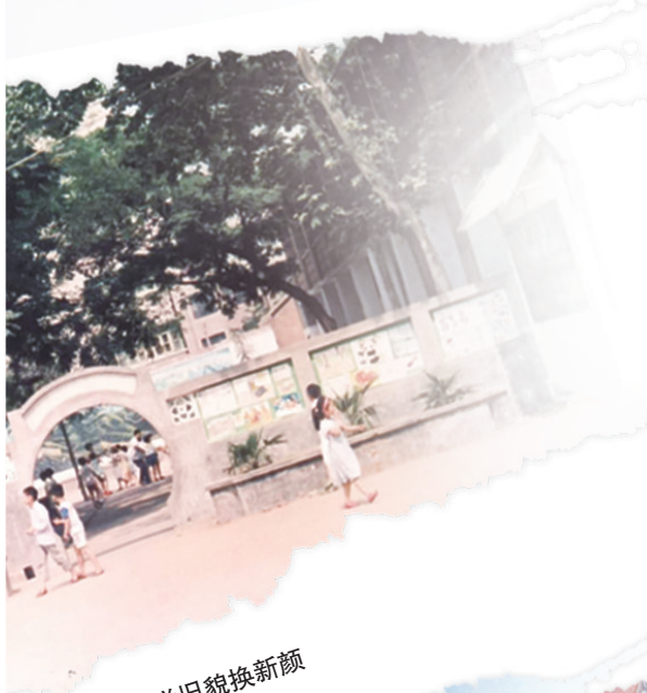
创新街小学旧貌换新颜