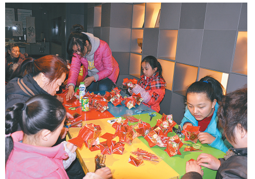
互动活动吸引了不少孩子和家

本报讯(记者 秦华 通讯员 刘璐 文/图)春节期间,在走亲访友、觥筹交错之余,很多市民走进博物馆,体验传统文化的魅力。据统计,从农历腊月二十九至正月初六的7天时间里,河南博物院免费接待观众近5万人次,讲解员及志愿者为观众提供讲解服务680批次。风格多样的陈列展览、主题鲜明的文化活动,让观众留存了一份博物馆里过大年的美好回忆。