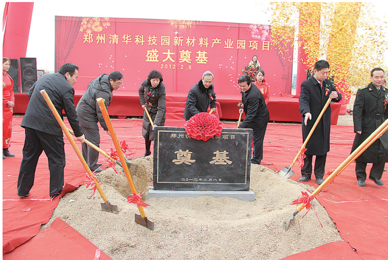
郑州清华科技园新材料产业园奠基仪式，该项目总投资3亿元，将建设成一个高标准的重点复合材料工程技术中心，同时将聚集一批技术密切相关的高科技新材料企业作为总部办公场所。