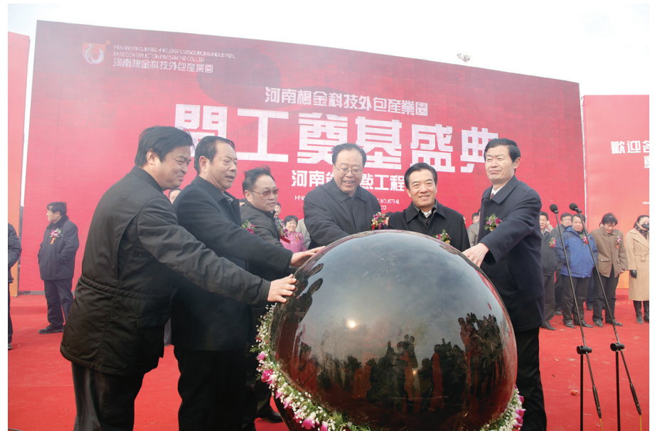
郑州市委副书记、市长马懿，郑州市人大常委会主任白红战，郑州市政协主席李秀奇，郑州市委常委、统战部部长王跃华，动河南杨金科技外包产业园项目水晶球。