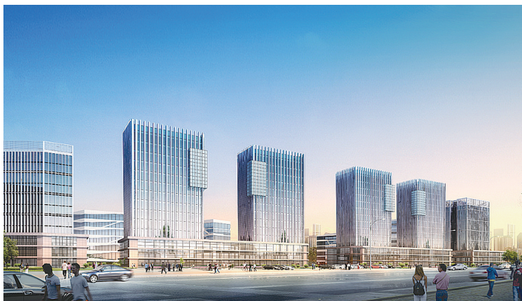
河南新科技市场项目总投资7.2亿元，将成为河南科技园区的研发、生产基地，承接河南科技市场内规模企业的转移，逐步形成中原地区软件人才和科技创业的集聚区。

提振精气神，当好示范区。2月8日上午，金水大地春潮涌动，河南杨金服务外包产业园项目、河南新科技市场项目、向心力通信产业园项目、郑州清华科技园项目、虹湾科技园项目和新庄合村并城安置项目等11个总投资75亿元的大项目在科教新城同日开工奠基。值得关注的是，此次组团开工11个项目均为高新技术产业、先进制造业、现代服务业、合村并城类项目，不仅为该区域今年在科教新城建设上力求突破争得先机，更彰显出金水区经济转型升级、调整产业布局的决心和行动。