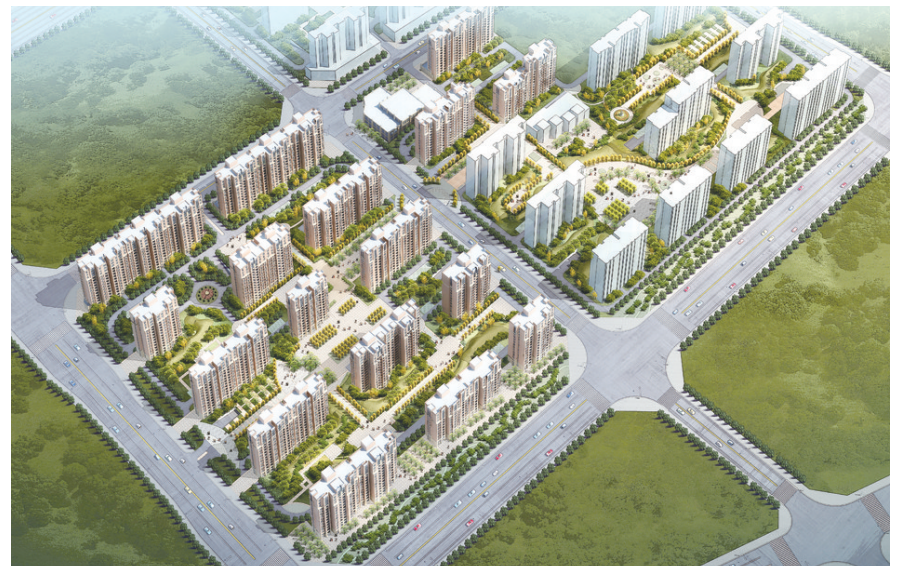
新庄合村并城安置项目，总投资12亿元，计划建设村民安置房约12188平方米，可安置村民89户、3189人。

“我们要集中精力引进一批有助于推动产业结构优化升级和对全区经济发展具有引领带动作用的项目，着力抓服务、搞协调、重落实，以科教新城的快速发展拉动全区经济快速增长。”金水区区长陈宏伟表示。