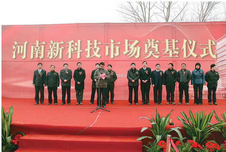
河南新科技市场奠基仪式现场