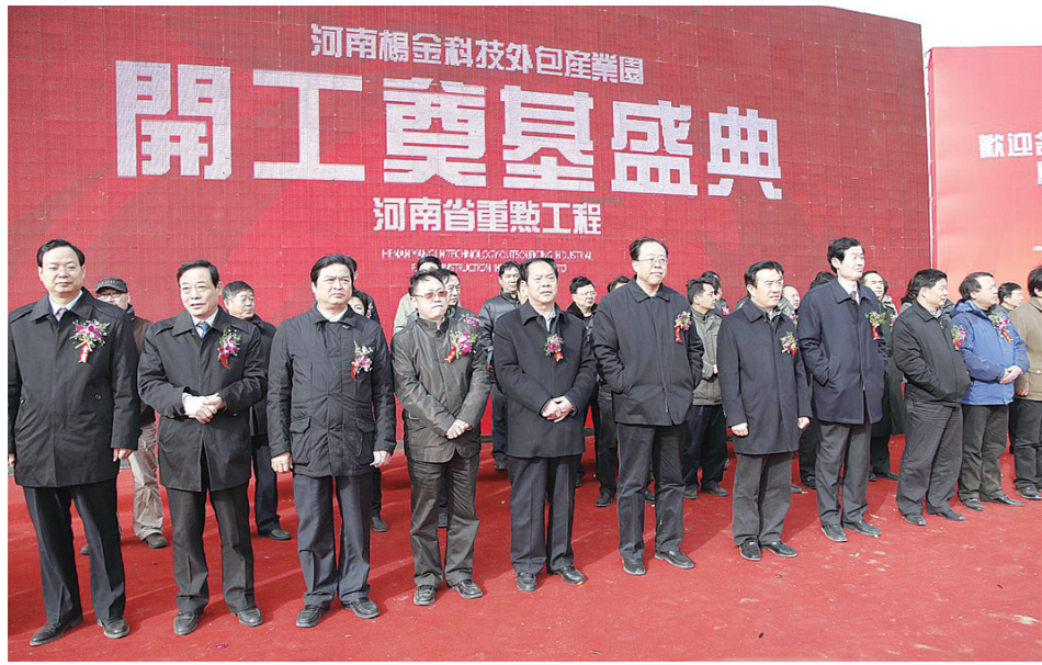
河南杨金服务外包产业园奠基仪式