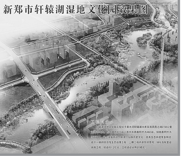
新郑市轩辕湖湿地文化园效果图

同时,加大水资源费征收力度,及时查处水事案件,维护正常的水环境和水秩序;切实加强饮用水水源地保护工作,持续加大技防、物防设施投入,在饮用水水源地安装了安全隔离护栏和视频监控设施,更换设置安全警示牌28处;实行昼夜巡查制度,保证了饮用水水源地安全。