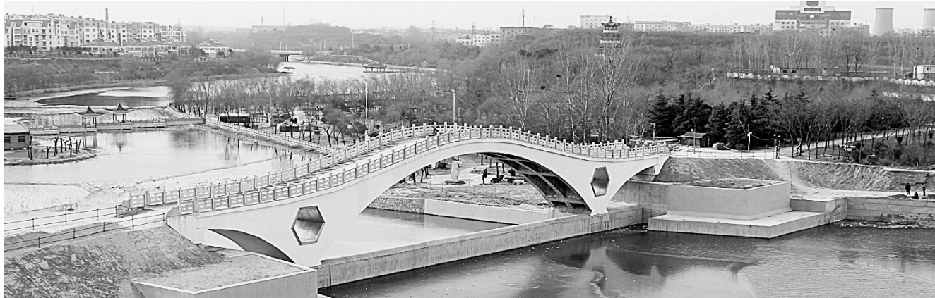
郑风桥犹如郑风苑上空的一道彩虹

水,北引黄河水,西蓄天上水,东治洪涝水,合理开发地下水,综合利用循环水,全社会厉行节约用水”为治水思路,突出“民生水利、效益水利、生态水利、平安水利、和谐水利、资源水利”六项重点,积极实现水安全、水环境、水景观、水文化、水经济“五位一体”的总体要求,推动传统水利向资源水利转变,工程水利向效益水利、和谐水利转变,水利事业的大发展为新郑市经济社会又好又快发展提供了坚强的水利支撑。