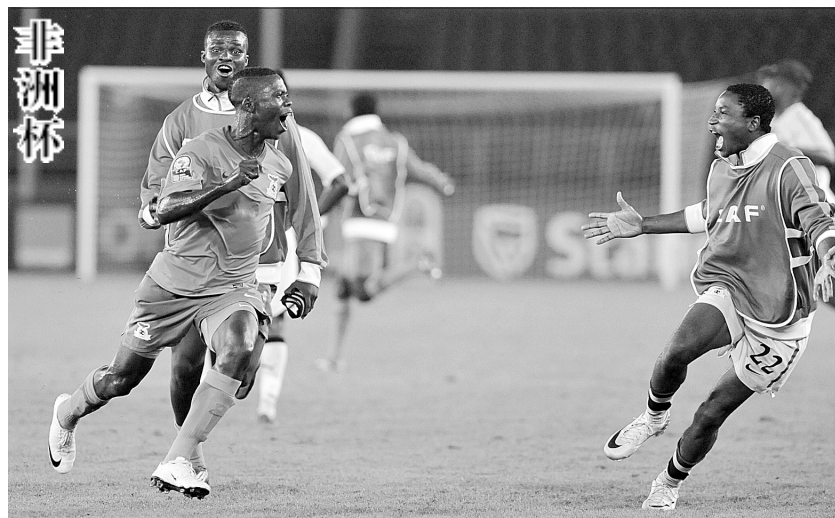
2月8日,赞比亚球员庆祝比赛胜利。