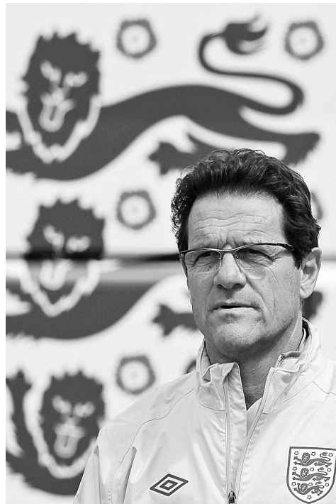
2月8日，英足总宣布，英格兰主教练法比奥·卡佩罗已经辞职。辞职的原因据报与英足总直接处罚英格兰队长特里有关。

赛后谈及队员们的表现，河南男排主帅谢国臣很是失望：“与对手相比我们是存在实力上的差距，可以说没有找到制约对方的办法，凸显出队伍能力不足，队员经验也不如对手。由于连输两场比赛，我们冲击四强的难度已经很大，但我们不会放弃任何希望，一定会全力以赴。”