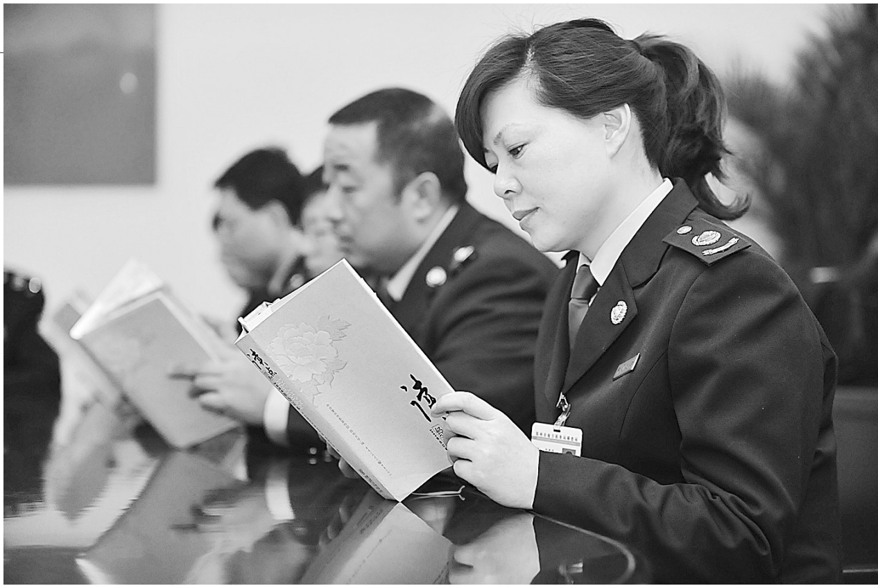
昨日,市地税局稽查局工作人员在阅览室静静地读书。为提高队伍整体素质,该局鼓励干部职工利用业余时间学习,引导员工养成多读书、读好书的良好习惯,全力打造学习型、服务型、务实型、创新型“四型机关”。

此外,今年我省将深入开展安全生产竞赛活动,进一步扩大参赛企业数和职工覆盖面,力争参赛企业达到3万家,覆盖职工700万人。