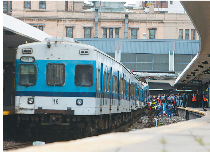
2月22日,在阿根廷首都布宜诺斯艾利斯,阿根廷救援人员救援城铁列车事故中受伤者。

当日,阿根廷首都布宜诺斯艾利斯发生一起城铁列车出轨事故,目前已造成至少40人死亡,550人受伤。