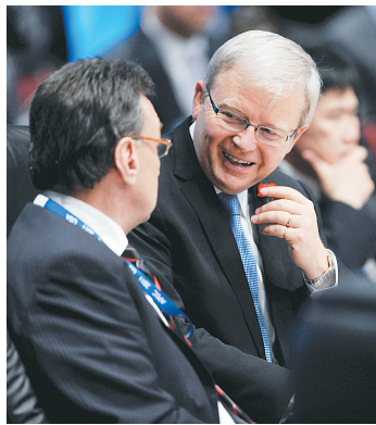
图为2011年11月11日,陆克文(右)在美国夏威夷檀香山出席亚太经合组织第23届部长级会议的资料照片。

据新华社堪培拉2月22日电 据澳大利亚联合新闻社22日报道,澳大利亚外长陆克文宣布因无法得到总理吉拉德的支持,决定辞去外长职务。