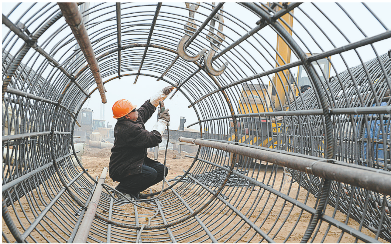
航海路—西三环立交桥目前正在紧张施工。在建设者夜以继日的努力下,预计在今年8月主体完工。