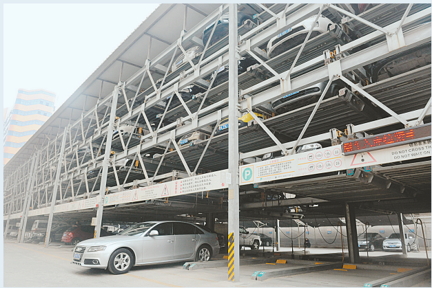
在市区繁华路段建立的立体停车库有效缓解了停车难问题。

通车后的郑开大道与京港澳高速互通式立交,增加了京港澳高速公路在郑州市城区的出入口,为畅通郑州提供强有力的支撑。