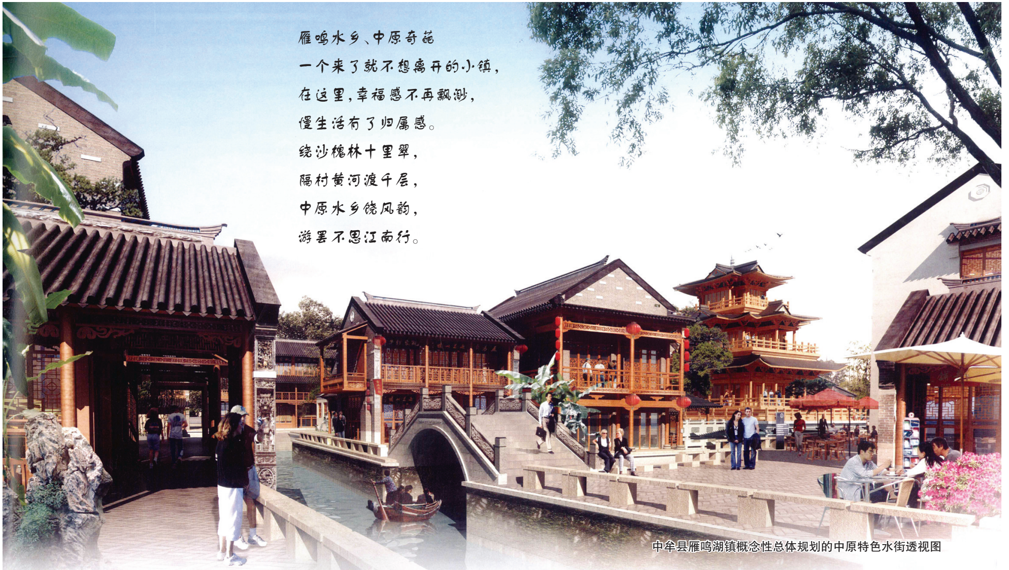
中牟县雁鸣湖镇概念性总体规划的中原特色水街透视图

雁鸣水乡、中原奇葩 一个来了就不想离开的小镇， 在这里，幸福感不再飘渺， 慢生活有了归属感。 绕沙槐林十里翠， 隔村黄河渡千层， 中原水乡饶风韵， 游罢不思江南行。