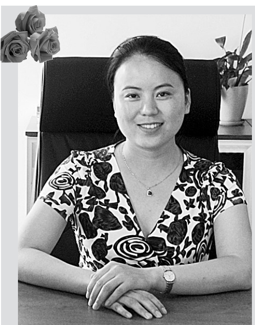
人物简介:现任上上集团地产(中原)事业部总经理。认识她的人都知道,她是一个事业与家庭兼顾的人;了解她的人都知道,在甜美笑容的背后是一颗追求完美,追求上进的心。