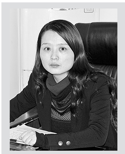
三八节寄语:最值得高度珍惜的,莫过于每一天的价值。

记者:进入房地产行业以来,作为女性地产职业经理人,您如何看待工作中的成败得失?这份工作给您带来了怎样的人生感悟?