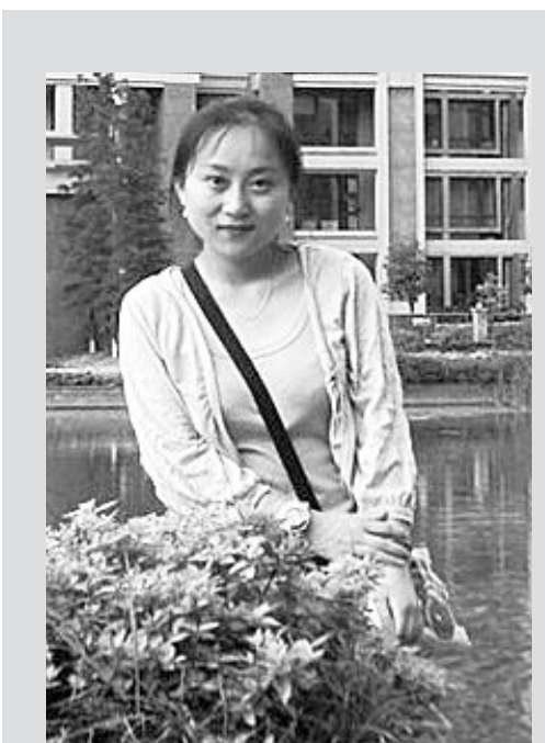
三八节寄语:但使岁月静好,现世安稳。

记者:作为女性地产人中的一员,您如何评价这一群体在地产行业的表现?您认为女性在工作中具备哪些独特的优势?