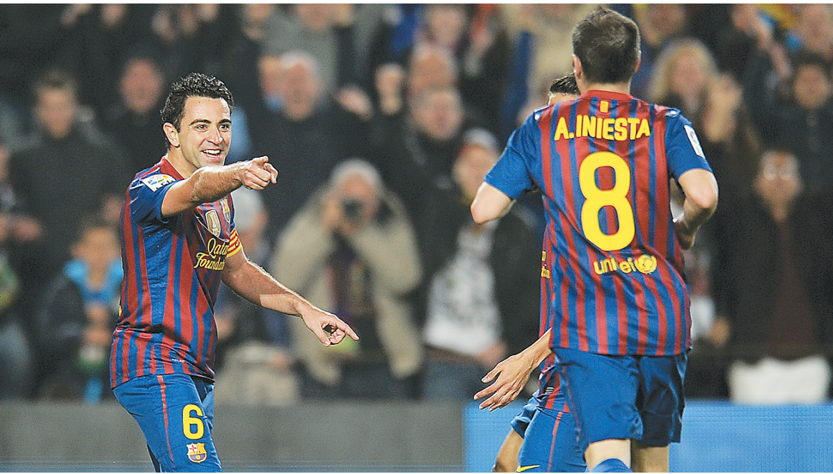
3月3日,巴塞罗那队球员哈维(左)与队友庆祝进球。当日,在2011/2012赛季西班牙足球甲级联赛第26轮的比赛中,巴塞罗那队主场以3:1战胜希洪竞技队。

对于联赛的赛风问题,足协已向俱乐部通报,球员一旦出现赛场违纪行为,将遭严惩。一位足协官员表示:“谁也别耍大牌,只要是滋事者,就重罚,决不姑息。”本次会议上,足协也提出了反腐问题,并要求各俱乐部一定要洁身自好,坚决杜绝假赌黑。不过,被重点强调的头号议题,仍然是反兴奋剂。