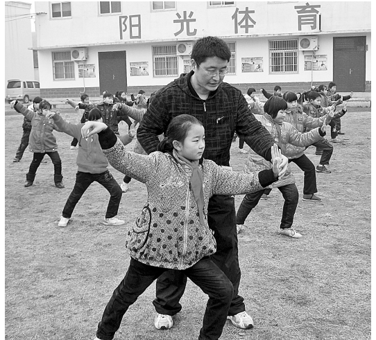
为丰富学生的体育文化生活,郑州市京水回民小学除了做广播体操、少儿拳操外,还把“24式简易太极拳操”引进校园,既激发了学生对课间活动的兴趣,又锻炼了体魄。