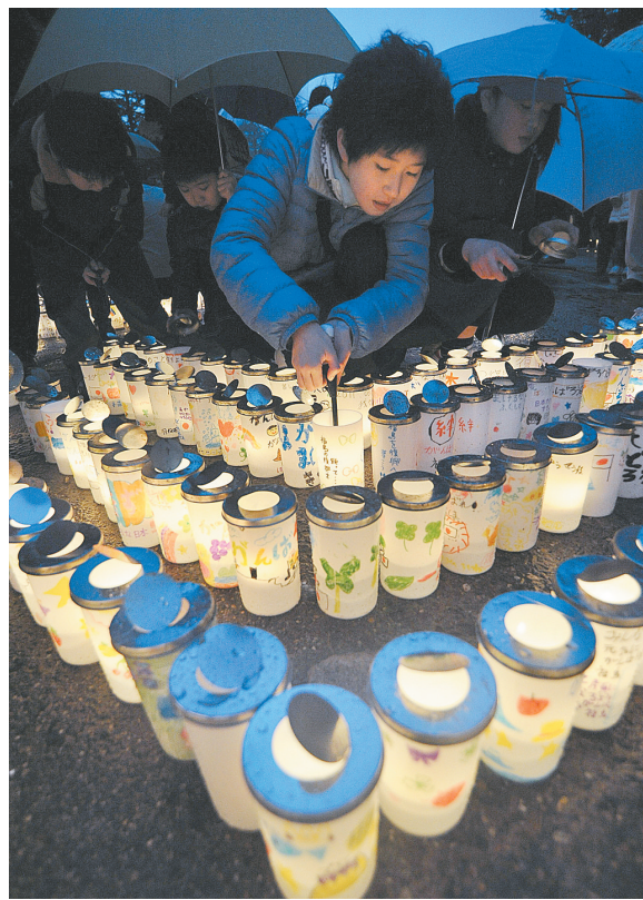
3月11日，在日本福岛县举行的“3·11”大地震一周年纪念活动上，人们点燃蜡烛悼念逝者。

据新华社东京3月11日电 日本首都东京和其他“3·11”大地震受灾地区11日举行各种活动，纪念大地震一周年。