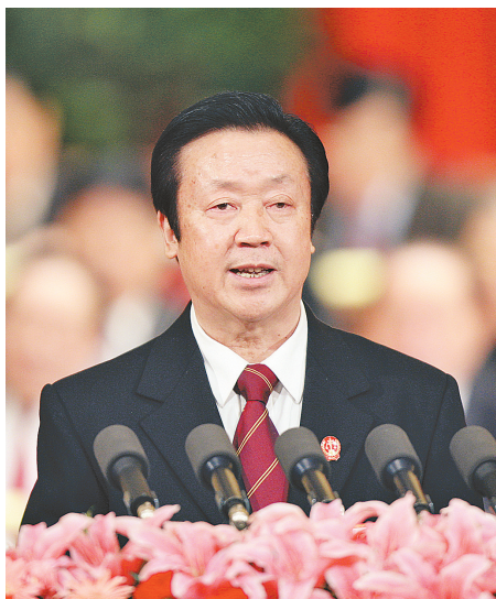
3月11日，最高人民法院院长王胜俊在十一届全国人大五次会议第四次全体会议上作最高人民法院工作报告。