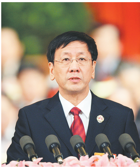
3月11日，十一届全国人大五次会议举行第四次全体会议，最高人民检察院检察长曹建明作最高人民检察院工作报告。