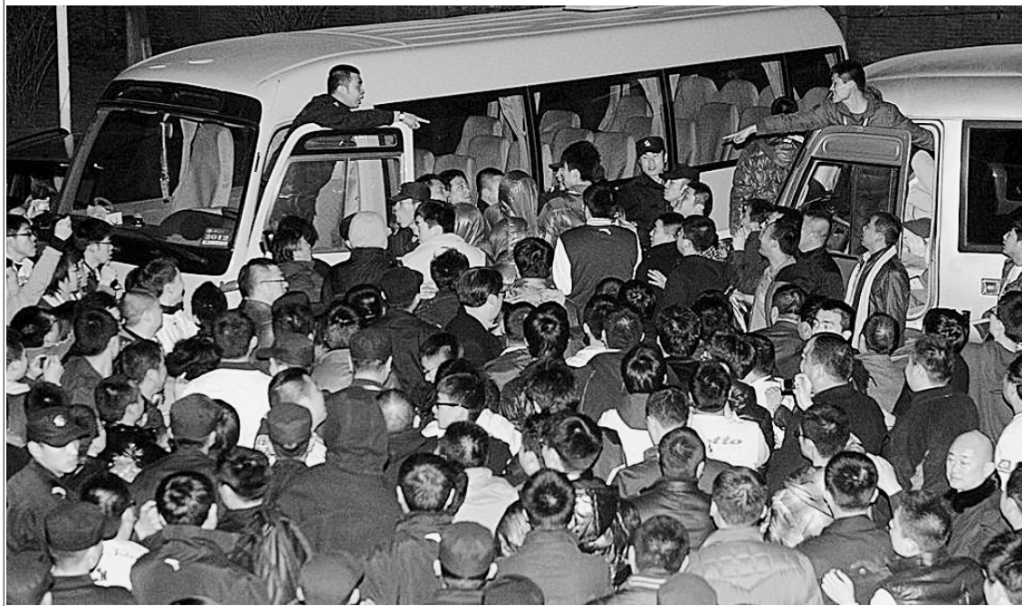
11日晚山西北京赛后,山西球迷围攻退场的北京队球员。

11日深夜,CBA赛后山西球迷围堵北京队大巴和北京球员、“马布里打人”的传言在网上流传开来,并迅速引发两地球迷的网上骂战。