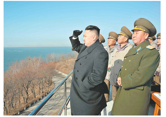
这张朝鲜中央通讯社3月15日提供的照片显示,朝鲜最高领导人金正恩(左)近日指导了朝鲜人民军陆海空三军联合打击训练。新华社发